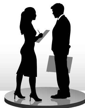
Открытость в деятельности