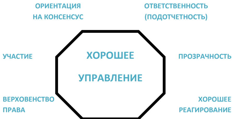
Рис. 1. Основные составляющие хорошего управления

Высокий уровень «Открытого правительства» означает внедрение эффективного или хорошего управления (good governance). Хорошее управление имеет восемь основных характеристик: участие, ориентация на консенсус, ответственность (подотчетность), прозрачность, реагирование, эффективность и результативность, равенство и учет интересов, соответствие принципу верховенства права. Хорошее управление призвано решить массу назревших проблем, таких как коррупция, бюрократические проволочки, нехватка экспертной среды в разработке нормативно-правовых актов, отсутствие общественного контроля за действиями власти любого уровня и многое другое. Взгляды меньшинства учтены и голоса наиболее незащищенных слоев населения учтены при принятии решений. Хорошее управление ответственно к существующим и будущим потребностям общества.