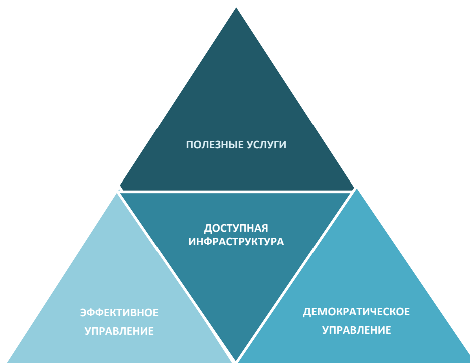
Рис. 2. Сферы электронной готовности

Перечень интегральных индексов верхнего уровня включает следующие: