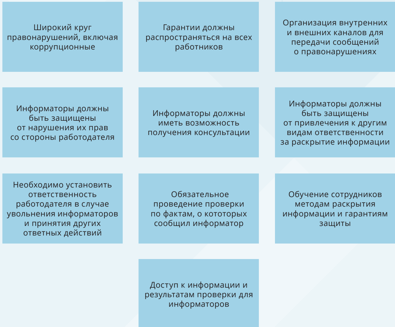
Рисунок 4. Десять ключевых факторов для мотивации к раскрытию информации о коррупции и для защиты информаторов

Сейчас в Казахстане действует только система поощрения лиц, сообщающих о коррупции, при условии вступления в законную силу постановления по административному делу или обвинительного приговора по уголовному коррупционному делу. За раскрытие информации выплачивается сумма от 30 до 100 МПР, в некоторых случаях — 10% от суммы взятки или полученных услуг (если стоимость превышает 1000 МПР). Другая отличительная особенность — сведения об информаторах защищены законом о государственных секретах.