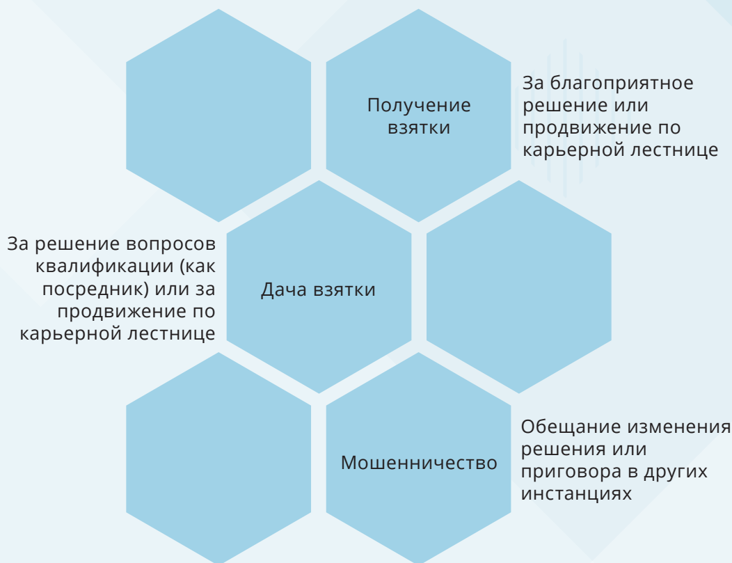
Рисунок 8. Основные коррупционные преступления, совершаемые судьями в Казахстане

Помимо фактов совершения коррупционных преступлений судьями, в коррупцию вовлечены и другие работники судебной системы, а также адвокаты, юридические консультанты и судебные исполнители.