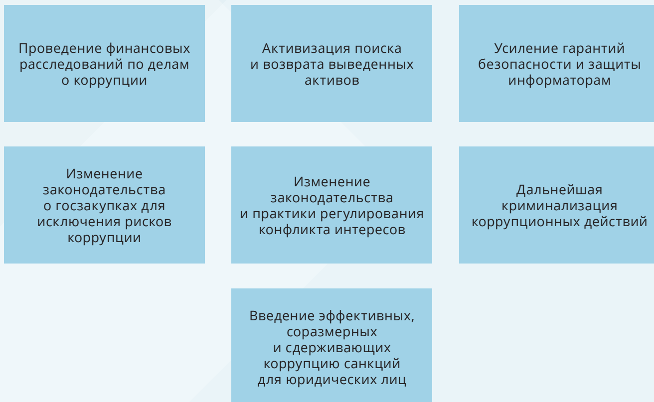
Рисунок 3. Позитивные аспекты новой антикоррупционной политики Казахстана