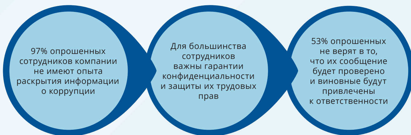
Рисунок 5. Результаты опроса сотрудников казахстанской компании квазигосударственного сектора

Также следует отметить и отрицательное отношение к информаторам о нарушениях и коррупции в госорганах и продолжающуюся практику давления, запугивания и увольнения информаторов 51 .